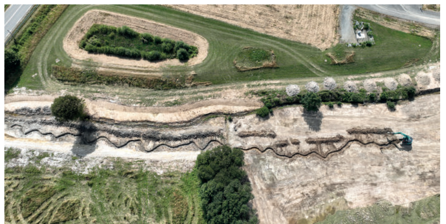
Ruisseau Le Borgnet, Saint-Méen-Le-Grand (35)

L'enquête s'est déroulée du 9 mai au 9 juin 2023. L'arrêté de DIG est paru le 15 septembre. Il permettra désormais à l'Unité de Gestion Vilaine Ouest de réaliser des travaux milieux aquatiques sur son périmètre d'intervention, soit sur 112 communes, jusqu'en 2030.