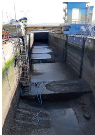
Investigations, barrage d'Arzal (56)

Les dépenses portent également sur le barrage d'Arzal marqué par des investigations supplémentaires en 2023 et 2024 et sur les ouvrages Amont . La prévention des inondations n'est pas en reste avec une augmentation de plus de 520 K€ sur le socle, notamment due principalement au succès de l'opération Alabri .