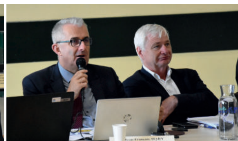
Comité syndical d'Eaux & Vilaine, le 20 octobre 2023.