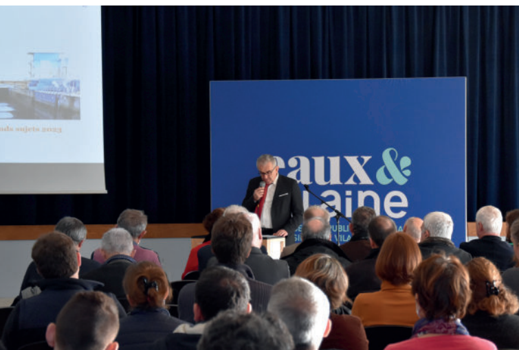
Voeux institutionnels d'Eaux & Vilaine, janvier 2023.