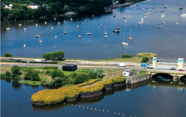
Gabions, barrage d'Arzal (56)

Les autres dépenses concernent principalement les travaux d'extension-réhabilitation des bâtiments de la Roche-Bernard, les achats de mobilier/matériel pour améliorer les conditions de travail/santé/sécurité des agents, les travaux de maintenance des barrages de Vilaine amont et la mise en service du futur navire rotodévaseur à l'horizon 2026.