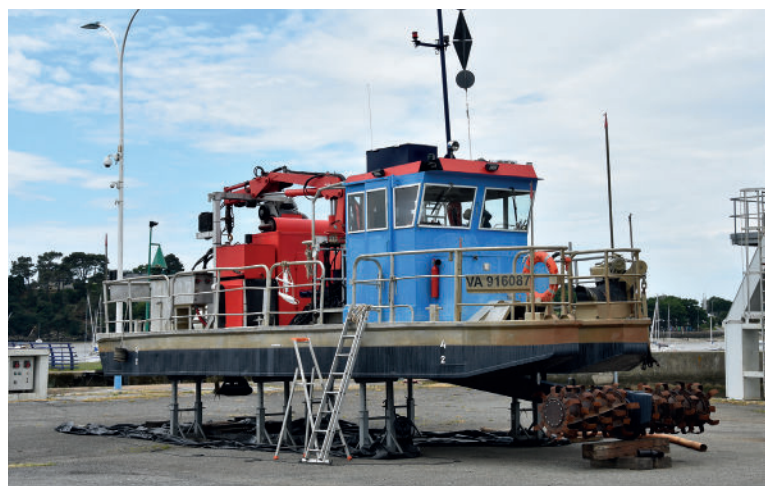
Rotodévaseur, barrage d'Arzal (56)

Concernant les compétences « à la carte », après une forte évolution de dépenses en 2022 en raison de l'intégration de nouvelles compétences GEMA sur la partie amont et de la montée en puissance de la compétence « Prévention des inondations à la carte », le montant total des charges de fonctionnement évolue fortement en 2023 pour se stabiliser à partir de 2024 autour de 3,5 M€ .