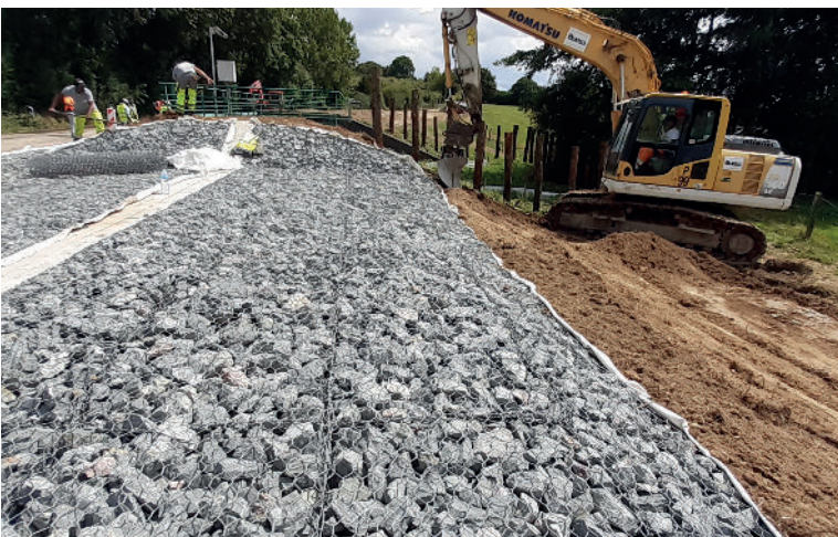
Travaux Prévention des inondations sur la Chère, été 2023.

Pour la carte, les investissements concernent la protection contre les inondations. Sur Châteaubriant-Derval, les études préalables à la réalisation de nouvelles retenues sur le Chère et le Rollard se poursuivront en 2024, avec l'objectif de déposer le dossier d'autorisation d'ici la fin de l'année. Sur Redon Agglomération, la réhabilitation du système d'endiguement de Saint-Nicolas-de-Redon démarrera à partir de 2024 sous réserve des conclusions des études réglementaires (présence potentielle d'espèces protégées). Enfin, sur Arc Sud Bretagne, l'année sera consacrée à la poursuite des études de maîtrise d'œuvre et réglementaires sur le projet de protection du bourg de Damgan .