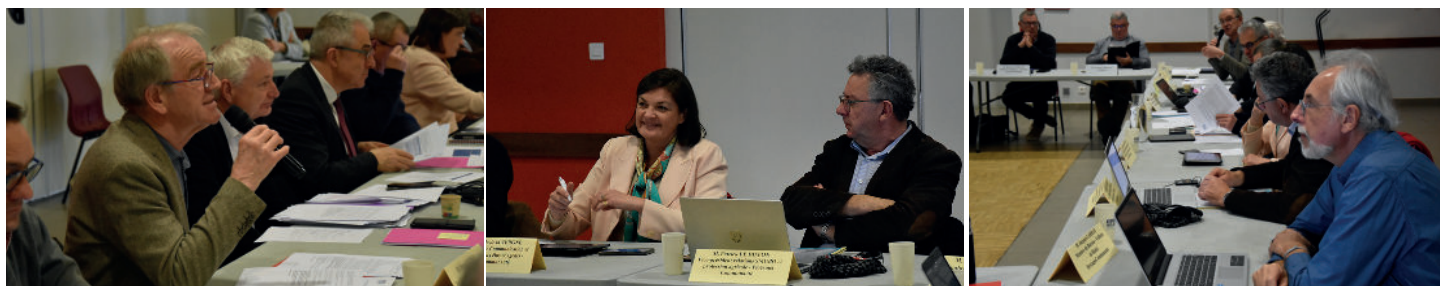
Comité syndical d'Eaux & Vilaine, le 15 mars 2024.