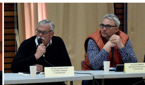
Comité syndical d'Eaux & Vilaine, le 15 mars 2024