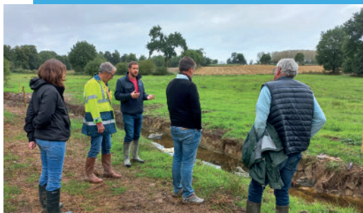
Visite de chantier de La Flume à Gévezé - Automne 2022