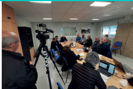
Conférence de presse à l'occasion du lancement de la phase de l'enquête grand public menée du 2 mars au 2 avril 2023.

Nombre de participants à la grande enquête en ligne menée du 2 mars au 2 avril 2023, dans le cadre de la révision du SAGE Vilaine.