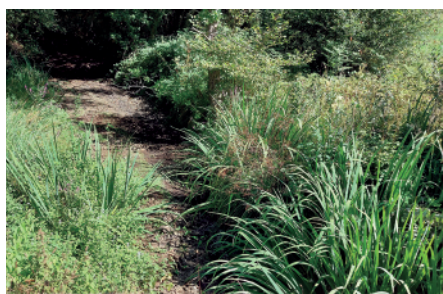
L'Ille le 4 août 2022 au lieu-dit de la Chaussée à Dingé.

Après avoir suivi les assècs, d'avril à octobre 2022, collecté et analysé les données, jusqu'en mars 2023, et réalisé la prospection de terrain des cours d'eau, des têtes de bassin versant et des zones d'alimentation, de janvier à mars 2023, le diagnostic des cours d'eau et la quantification des pressions sont établis. Prochaine étape : la définition des objectifs, des enjeux et le programme d'actions avant la fin de l'été.