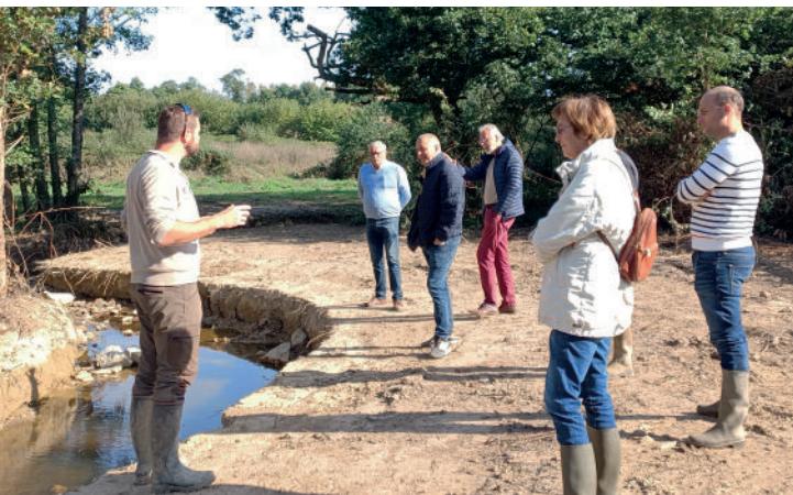
Visite de chantier - Été 2022